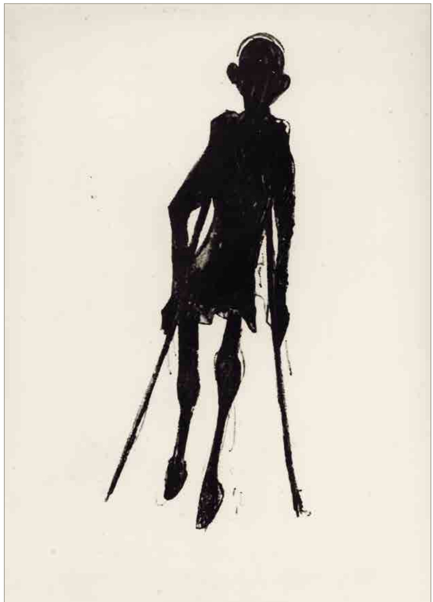
„Fra ,Schonungsblock'en, invalidernes og de lemlæstedes helvede" (Im „Schonungsblock“, die Hölle für Invaliden und Versehrte). Zeichnung von Per Ulrich, nicht datiert.